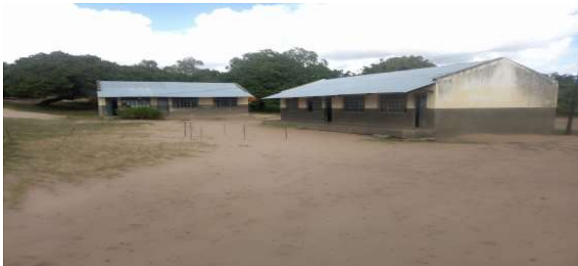
Figura 1: Vista frontal da EPC de Goine, no Posto Administrativo de Zongoene