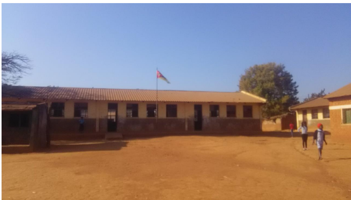
Figura 1: Imagem da escola