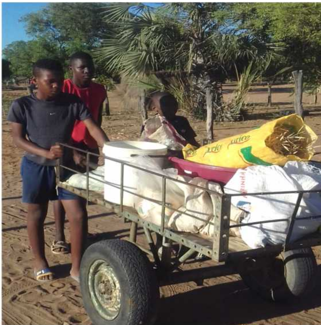
Figura 4: Crianças com frequências irregulares devido a ganância de dinheiro.

O processo de Ensino e Aprendizagem tem como mediação o professor e aluno tendo como objectivo a construção de conhecimento que são partes constituintes do processo do processo do conhecimento.