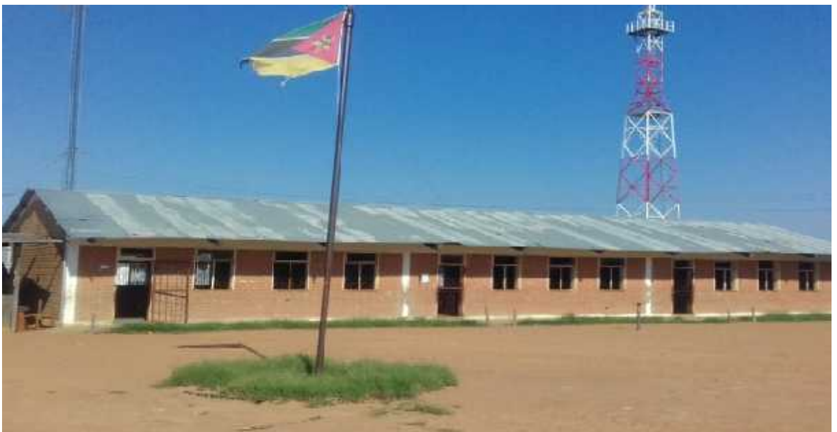
Figura 2: Bloco de Salas de Aula.

Assim se encontra estruturada a escola Primária do 1º e 2º Graus Eduardo Mondlane: