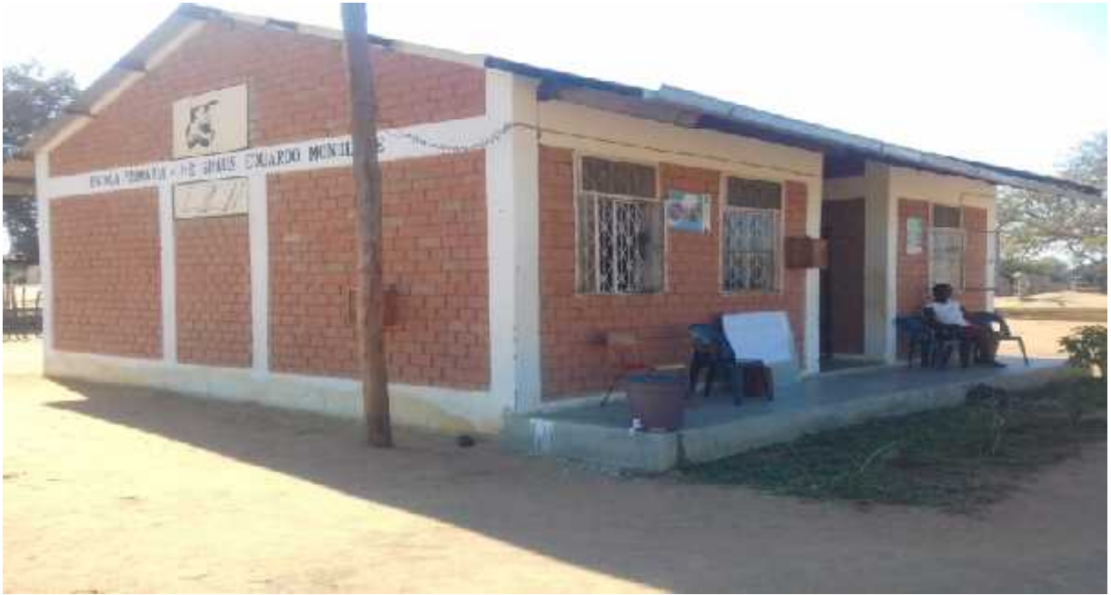
Figura 1: Bloco Administrativo.