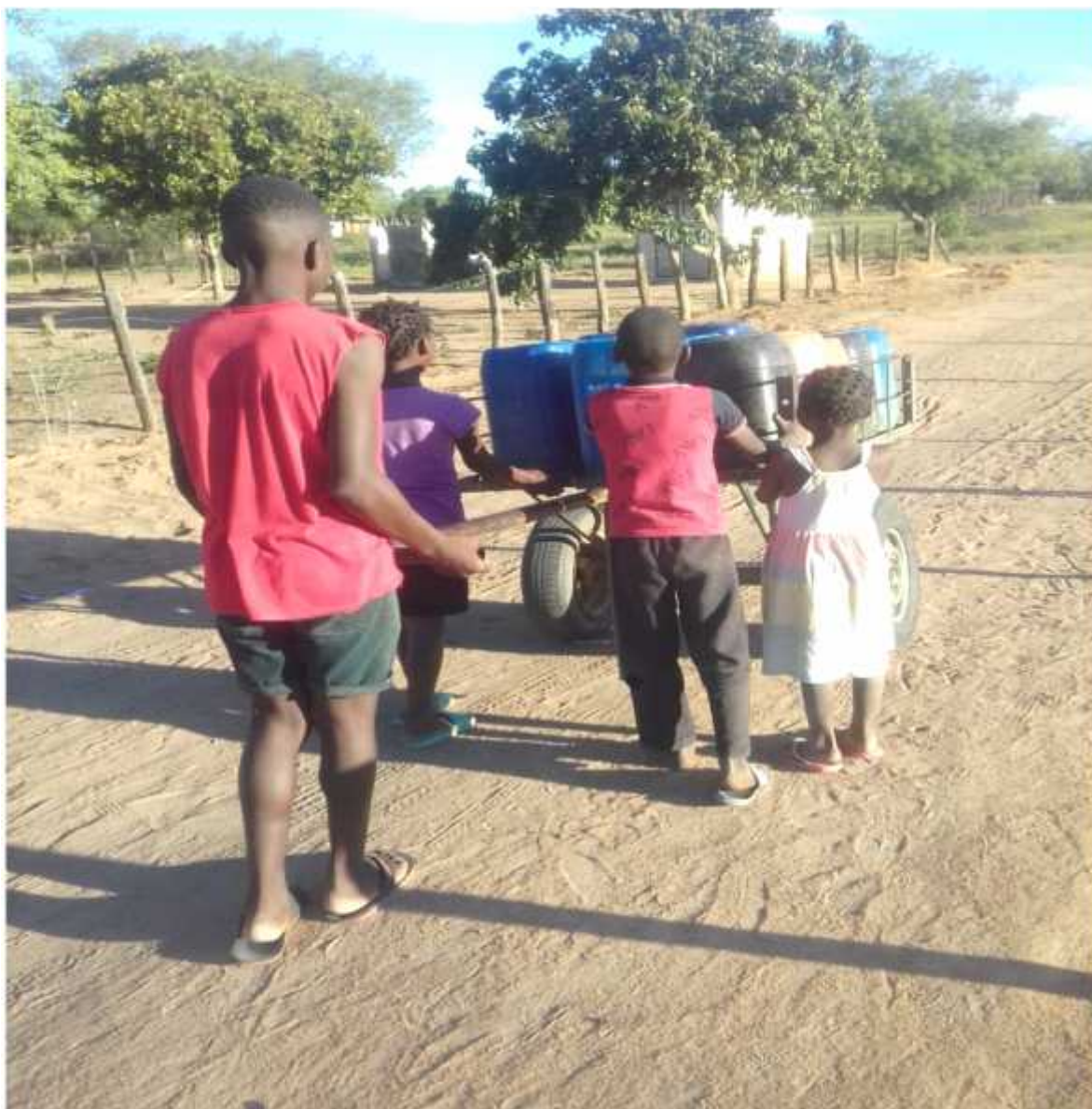
Figura 3: Actividades domésticas que culminam com as frequências irregulares dos alunos.

Para além de frequências irregulares promovidas pelos pais e encarregados de educação, algumas crianças faltam a escola por iniciativa própria alegadamente procura de emprego precário como forma de suprir eventuais necessidades. São crianças que procuram de todo gás faltarem à escola para abraçarem actividades lucrativas que na língua local são denominadas “XIKWAKWA”, conforme ilustra a figura 4.