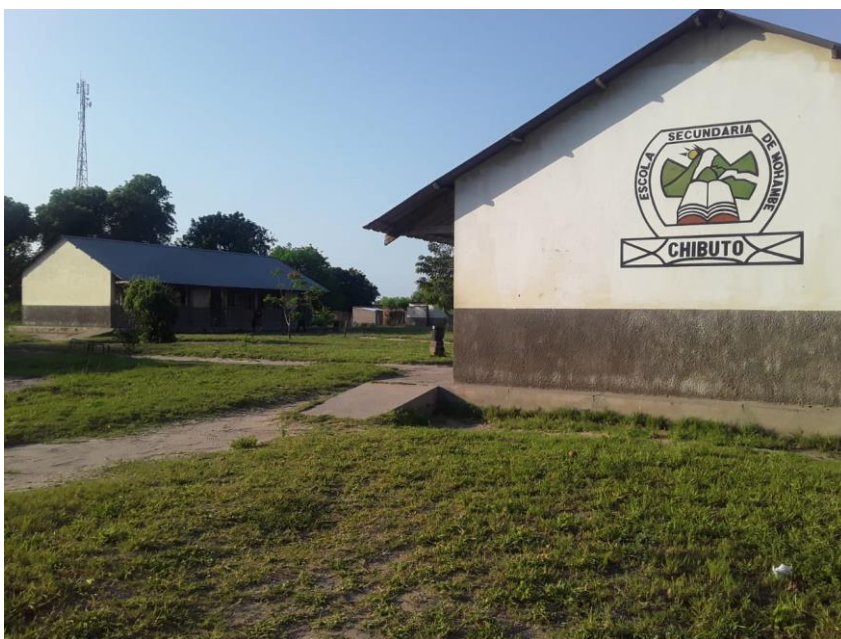
Figura 1: Parte frontal da escola

O estudo proposto foi realizado no recinto da Escola Secundária de Mohambe, localizada, no Bairro do mesmo nome, distrito de Chibuto, Província de Gaza. Faz limite no Este e sul com Chaimite, Norte com o Bairro de Mbanhel e Oeste com o rio Limpopo.