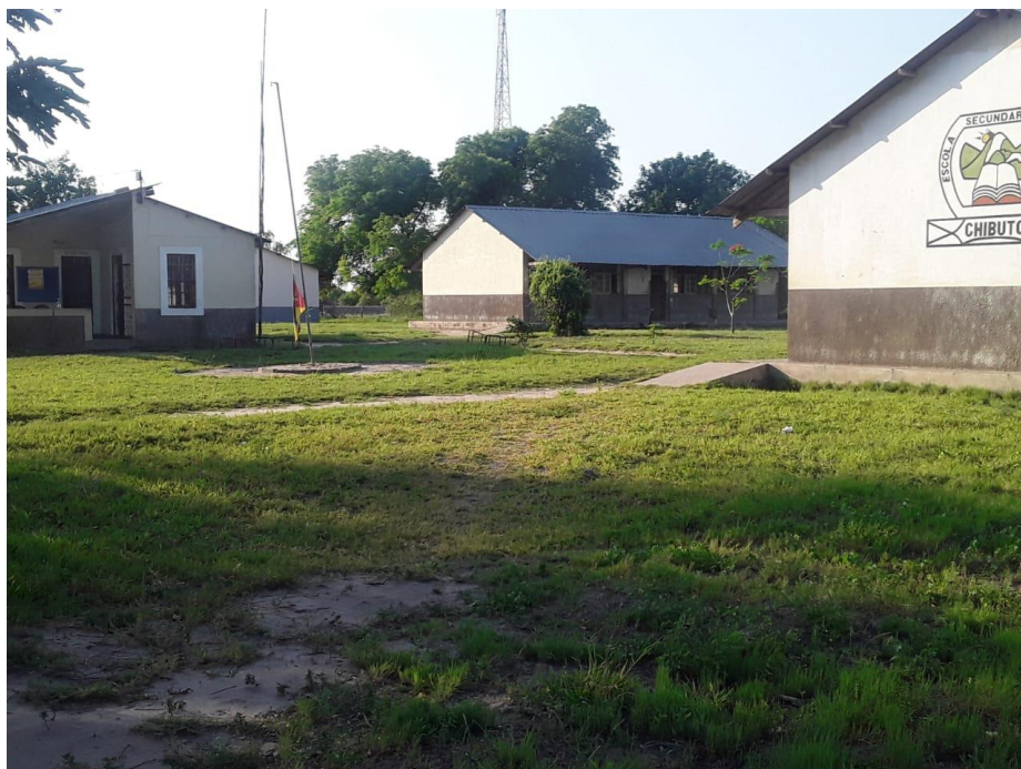
Figura 2: A disposição dos blocos