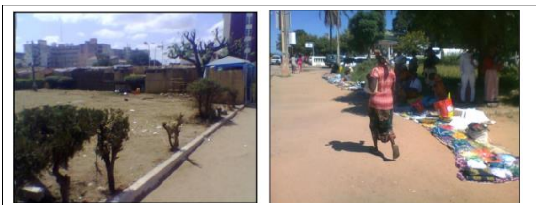
Fig.6. Barracas instaladas no JPDF

Desde 1999, neste mesmo local, construíam-se, sazonalmente barracas de material precário em datas festivas (fig. 6), como o dia da Cidade (22 de Agosto) e outros feriados nacionais, vinculadas à prática do comércio de alimentos confeccionados e bebidas alcoólicas, jogos de tipo lotaria e outras relacionadas as atividades informais e cobrava-se uma taxa de implantação e comercialização diária naquele jardim. Ainda aqui em 2012 (fig.7) até o ano de 2015 vendia-se informalmente capulanas, camisetas e bonés relacionados a diversas datas comemorativas em condições de informalidade e cobrava-se, ou melhor, se cobra uma taxa de uso do espaço.