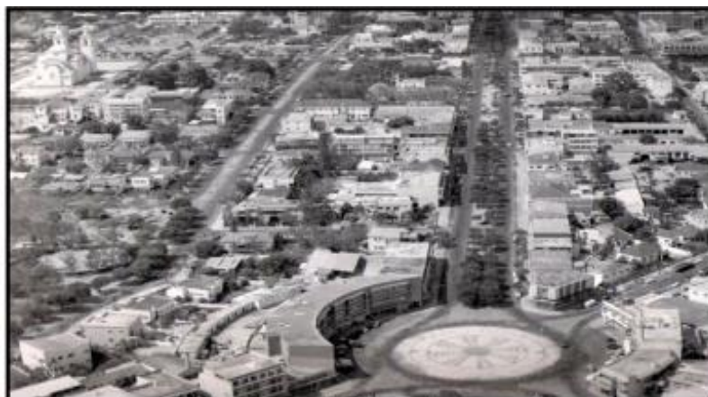
Fig.1. Av. Marchal Carmona, Actual Av. Paulo S. Kankhomba arborizadas nos anos 1960

De acordo com Pereira (1966), nos anos de 1960-1970 a área central da cidade de Nampula constituía uma malha urbana em retícula formada por uma série de avenidas e ruas de traçado reto e arborizadas, paralelas entre si, dispostas no sentido aproximado de norte-sul, como mostra a figura 1. Este sistema viário partiu da área de génese da cidade, o setor da estação ferroviária, articulando-a com as rotundas e praças situadas a sul (sendo a mais importante a rotunda que serve o hospital). Também a sul, a Rua Luís de Camões rematava a malha referida (a meia esquadria), e, no setor a poente, uma praça maior integrava a Catedral e a Conselho Municipal.