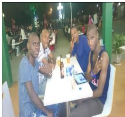
Fig. 9. Uso do JPDF de noite

A apropriação do espaço do JPDF sofre influência da mudança de caráter da ocupação espacial da área. Até essa época em que a área era quase totalmente ajardinada e sem infraestruturas ligadas ao comércio e consumo, a separação espacial entre classes sociais não era restrita e os encontros eram principalmente na circulação. Todavia, atualmente, em algumas áreas no seu entorno que eram acessíveis ao público estão privatizadas e ligadas ao consumismo de acesso restrito. (caso do Restaurante Salsa Pimenta). Dessa forma, o local é frequentado maioritariamente por indivíduos aparentemente de classe média baixa e alta sobre os restaurantes como espaço privado e elitizado, oferecendo o lazer de requinte.