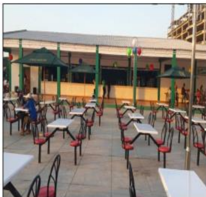
Fig. 8. Uso do JPDF de dia

tarde, quando o sol se põe e as pessoas saem do trabalho e da escola, verifica-se maior aumento significativo e intensivo de pessoas (Fig.9) no uso da praça e o movimento começa a cair depois das 9h da noite.