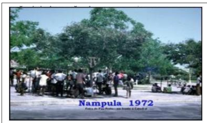
Fig. 5. Apropriação da antiga Praça Dr. Oliveira Salazar, actual JPDF antes de 1975

De acordo com o relato de antigos moradores da cidade e pesquisas bibliográficas efetuadas, este jardim já foi apropriado por comerciantes informais, legalmente formalizados desde o período colonial, onde se vendia objetos de adorno e cultura local e regional conforme a figura 5. Ilustra ano de 1972 a “apropriação” como local de prática do comércio “informal” aos domingos, que era designado feira do “Pau-Preto” ou “Feira Dominical”, onde se comercializavam objectos de adorno domiciliar, utensílios domésticos, de fabrico local ou regional. Este fato pode considerar-se o marco do início da legalização da prática do comércio (in) formal neste espaço livre, pois era cobrada uma taxa para o uso do espaço para prática desta actividade.